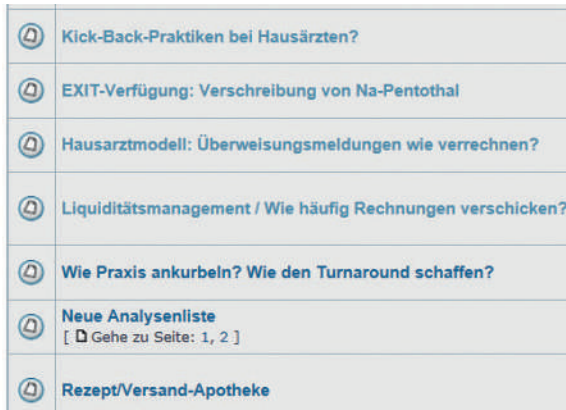
Figure 2: Extrait du forum «les médecins de famille et de l'enfance entre eux».

les pédiatres, et il semble qu'il continue à répondre à un besoin. Notre forum permet d'avoir une discussion en temps réel et interactive, à la différence de ce qui se passe pour le courrier des lecteurs. Cet échange «horizontal» constitue pour nos représentants un apport précieux lorsqu'il s'agit de rester en phase avec la base. Le forum offre par là la possibilité de se former une opinion, il aide à formuler des demandes de manière claire, il crée des contacts et «prend la température du terrain».